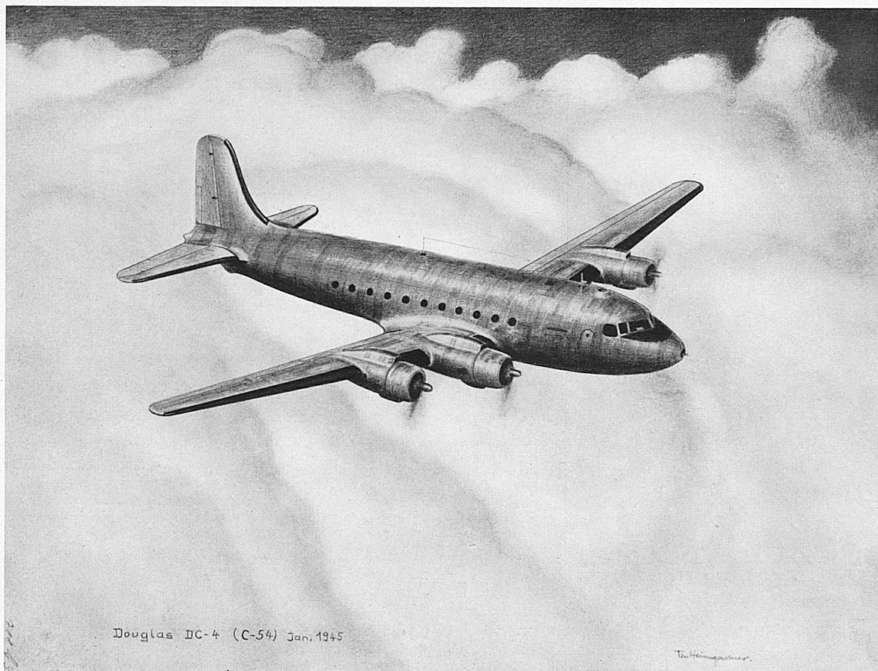
Le quadrimoteur Douglas DC-4, avion de transport militaire le plus utilisé par les Américains pour survoler l'Atlantique du Nord. — Die viermotorige Douglas DC-4, das vom amerikanischen Militärtransportsystem auf dem Nordatlantik am häufigsten eingesetzte Großflugzeug.

Nach einer Zeichnung von Th. Heimgartner