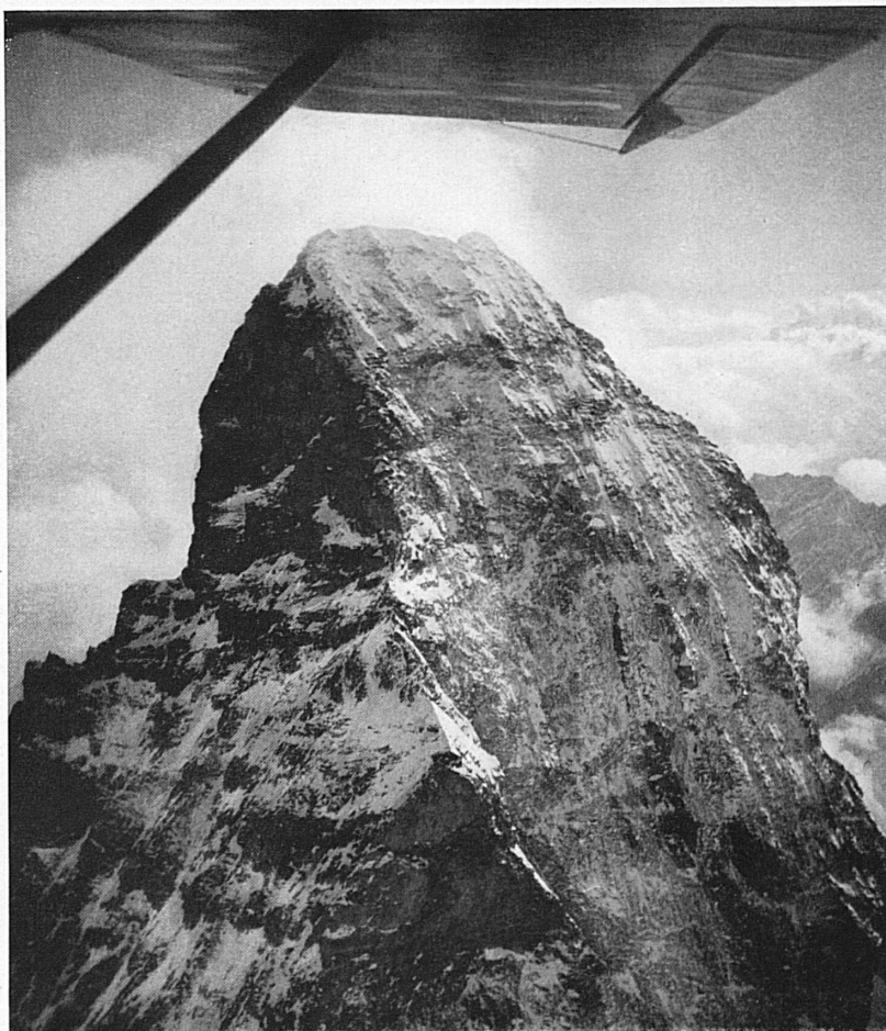
Le Cervin. — Das Matterhorn.

Pour la Suisse en tant qu'Etat purement continental, sans issue à la mer, l'heure historique a maintenant sonné de se