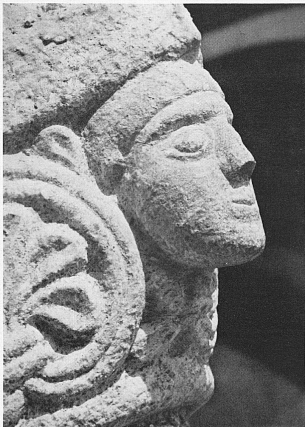
Particolare d'un capitello romanico nella chiesa di San Vittore a Muralto. Detail eines romanischen Kapitells in der Kirche San Vittore in Muralto.