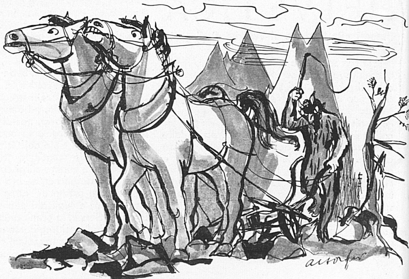
Das Ackerfeld des Satans. Les labours de Satan.