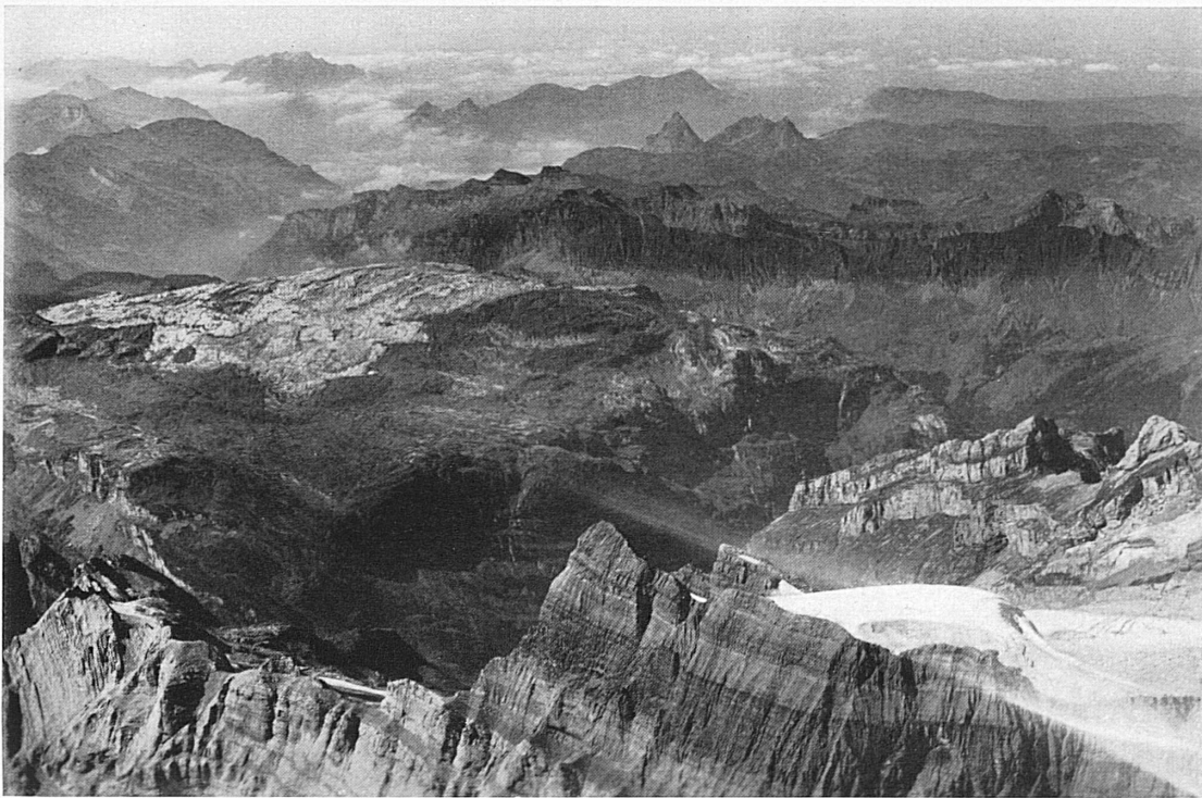
Vue aérienne de la région du Glärnisch, vers l'ouest, sur le plateau carstique des Silbern; à l'arrière-plan, l'échancrure de la vallée de la Muota, le Fronalpstock, le Pilate, le Righi et les Mythen.

Blick vom Flugzeug aus der Glärnisch-Gegend nach Westen auf das Schratten-Plateau der Silbern; dahinter Einschnitt des Muotatales, Fronalpstock, Pilatus, Rigi und Mythen.