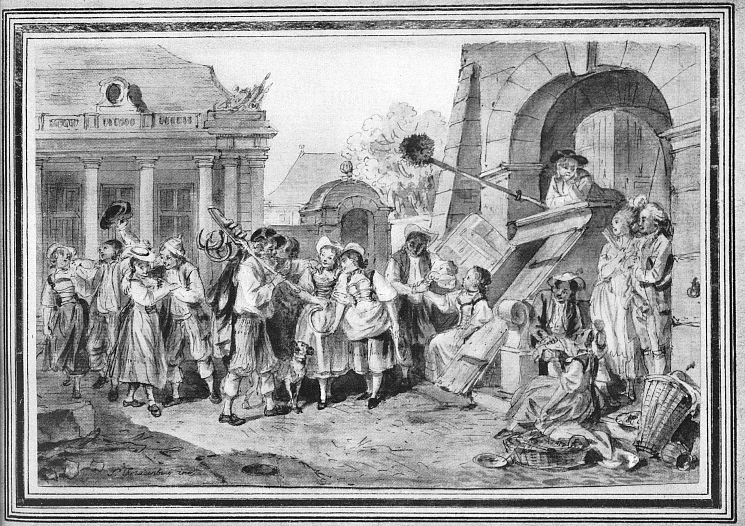
Der Knechtenmarkt in Bern. — «L'engagement des domestiques de campagne à Bernes».