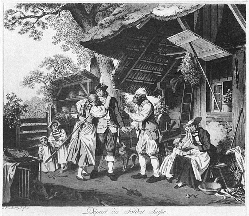
Départ du Soldat Suisse.

«Départ du Soldat suisse», Kolorierter Umriß-Stich. — «Départ du Soldat suisse», estampe coloriée.