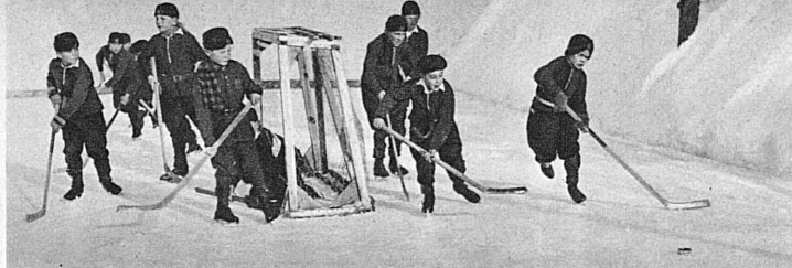
Hockey chez les petits