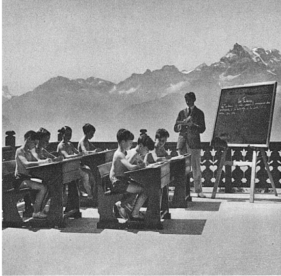
Grammaire au grand air (Villars)