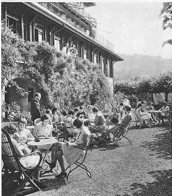
L'étude au soleil (Chexbres)

Il est vrai que nous avons pensé l'Emile, par le cerveau de notre concitoyen Rousseau, et que le grand frisson de renouveau qu'il fit courir dans le monde des éducateurs n'était en somme que le frisson de nos lacs suisses, cette grande humeur de liberté et de santé qui évalue naturellement nos rivages. Mais l'Emile, cette imagination de Rousseau dont Pestalozzi fit un fait, devait devenir une façon d'idéal d'éducation, qui n'a plus cessé de hanter la pensée des pédagogues, et qui demeure indissolublement lié à l'heureuse nature où ce parangon s'est formé. Je ne sais plus qui proposait de baptiser la Suisse romande l'Emilie. Car la réputation des lieux s'est étendue aux hommes, et l'on s'est mis à voir dans chacun de nos Romands un éducateur-né, tout comme le Breton naît marin, le Tessinois maçon, le Jurassien horloger. En a-t-il fourni au monde, aux palais, aux grands de tout ordre, aux collèges de toutes couleurs, des maîtres et des précepteurs, ce petit pays vert et bleu, où l'harmonie des choses conduit naturellement à cultiver l'harmonie intérieure et à l'enseigner à son tour, du fameux César de la Harpe qui forma l'esprit d'Alexandre 1 er à la gouvernante du