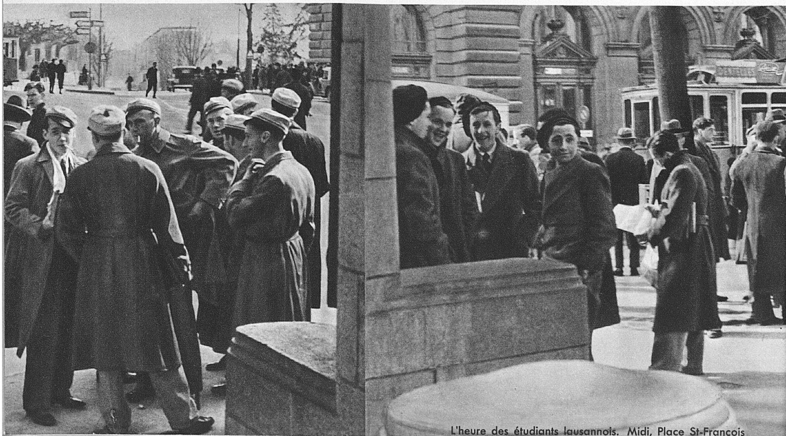
L'heure des étudiants lausannois. Midi, Place St-François