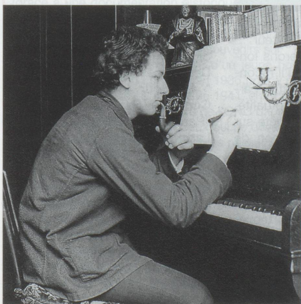
À Paris, hiver 1913-1914.