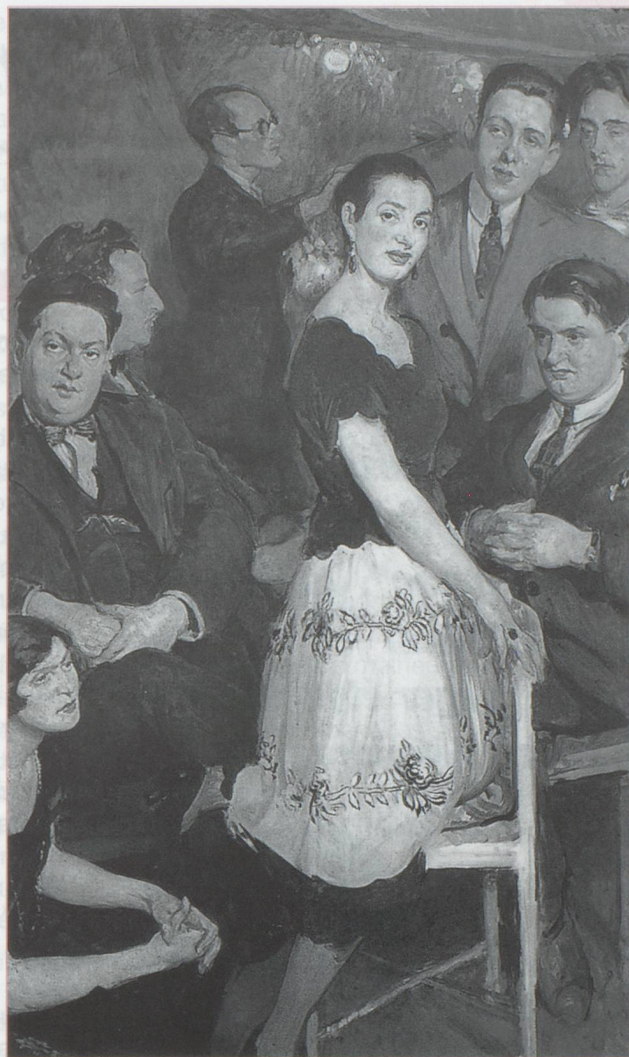
Le Groupe des Six peint par Jacques-Émile Blanche (1861-1942). À l'extrême gauche de la toile, on reconnaît Germaine Tailleferre, Darius Milhaud et Arthur Honegger (de profil).

La France, la Suisse. Toujours sagement, Honegger part faire son École de recrues au moment de la guerre et revient à Paris, rue de Madrid, pour étudier cette fois avec Charles-Marie Widor et Vincent d'Indy. La musique religieuse et le post-wagnérisme. Il se fixe à Paris, fréquente les "montparnos", devient l'ami de Darius Milhaud, écoute Satie, écrit