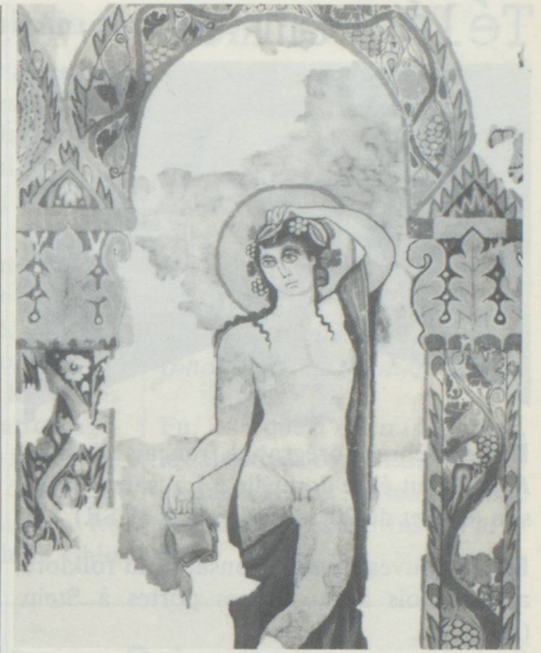
Le dieu de la vigne, personnage central de la tapisserie de Dionysos.

La salle où ce chef-d'œuvre est exposé – en