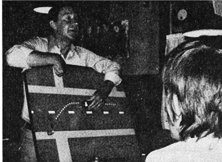
In der Theorie wird richtiges Fahrverhalten anhand von Modellen genau demonstriert.

Für nächstes Jahr will die VGM weitere Kurse im Kalender aufstellen. Die VGM empfiehlt allen Autolenkern diesen Kurs einmal zu besuchen. Beachten Sie unsere Anzeigen in der GZ oder erkundigen Sie sich beim Präsidenten der VGM. Verlangen Sie bei ihm kostenlos die VGM-Nachrichten, Herbstausgabe. wg