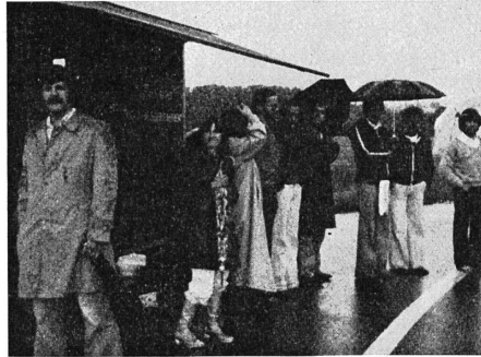
Fährt er richtig? Gespannt verfolgen die Kursteilnehmer, wie ein Kamerad auf der nassen Piste ein Bremsmanöver durchführt.