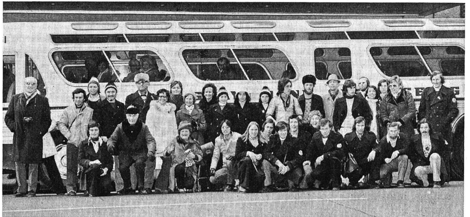
Familienbild der Sportler und Schlachtenbummler vor dem riesigen Autocar, der sie nach dem Abschluss der Winterspiele nach New York brachte.

Beinahe alle Jahre wieder gibt es eine Stolperei bei der Hürde Abrechnungen der Unterabteilungen. Bei der Abrechnung der Abteilung Fussball wurde eine neue, klarere Darstellung gewünscht.