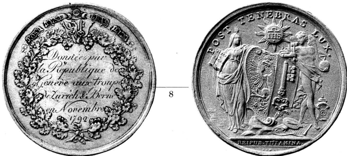
MÉDAILLES DU « SECOURS SUISSE » A GENÈVE