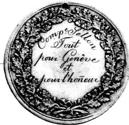
MÉDAILLES DU « SECOURS SUISSE » A GENÈVE