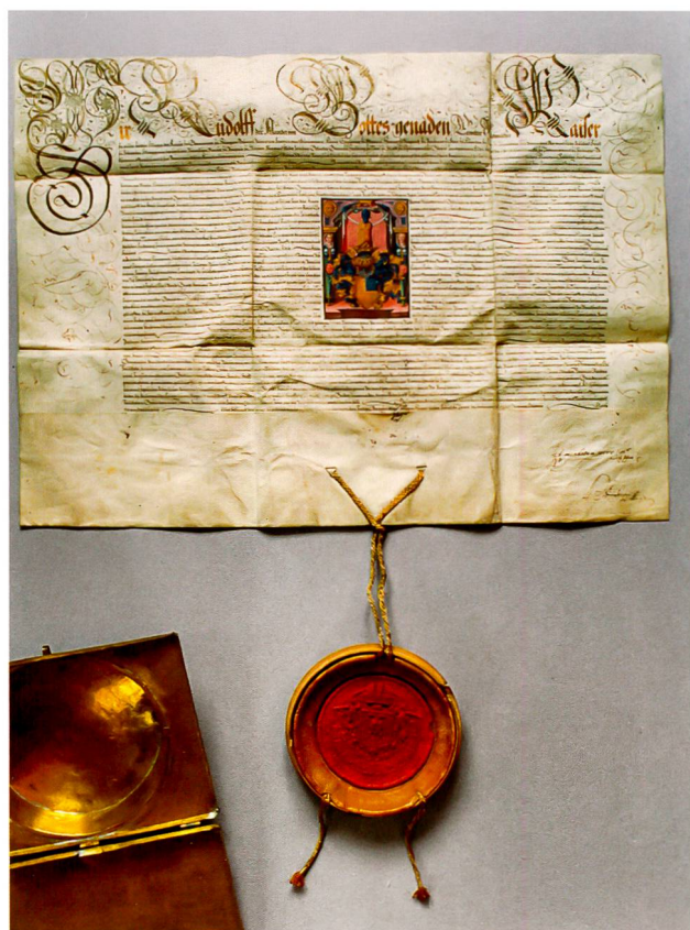
Abb. 1: Adelsbrief 1578 und vergrösserte Helm vignette

Die prachtvolle, mit dem Siegel Rudolphs II. geschmückte Urkunde der kaiserlichen Kanzlei in Prag 1 wurde im für den Prager Hof typischen Look-Out der späten deutschen Renaissance mit prägnanter Herrscher-Nennung «Rudolff der Annder» in der Kopfzeile, einer detaillierten Nennung aller durch den Adelsbrief ermächtigten Söhne Georgs I. Zollikofer (1492–1539), ihrer Rechte und Pflichten und einer Beschreibung des Wappens, welches ausserdem in der zentralen farbigen Bildvignette prominent dargestellt wurde, ausgestellt.