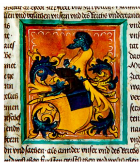
Abb. 2: Wappenbrief 1471, Helm vignette

Das Wappen mit blauem linkem Obereck 2 auf goldenem Schild blieb zwar unverändert gegenüber demjenigen, das der Familie bereits 1471 von Friedrich III. in Graz per Wappenbrief zugesprochen worden war 3 , hingegen wurde der Helm und die Helmzier massgeblich den neuen Rechtsverhältnissen angepasst