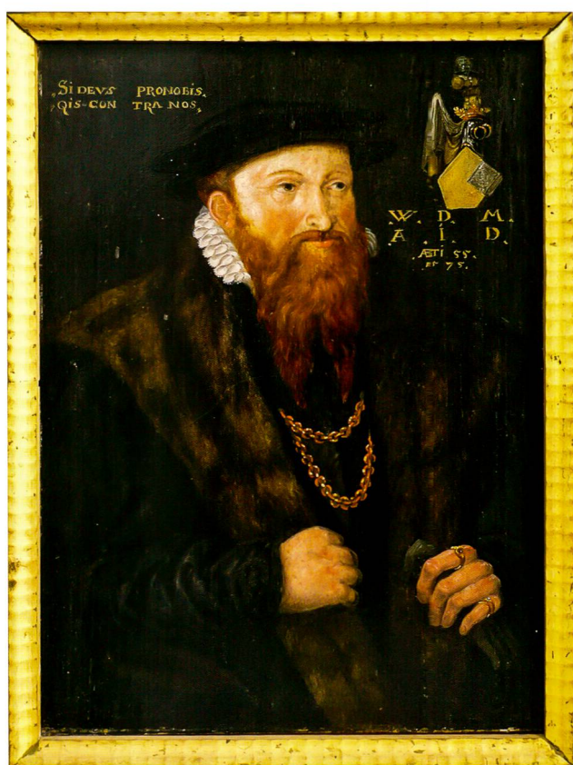
Abb. 3: Laurentz I.

Die seit Haller unwidersprochene Datierung auf 1577 bzw. 1575, also vor Ausstellung des Adelsbriefs im Jahr 1578, basierte auf einer missverständlichen Interpretation der Legenden und übernahm «VERSCHID [...] IM 1577 IAR» als absolute Datierung. Eine solche ist aber nicht haltbar: Das Wappen mit den adligen Helmerweiterungen vom 19. Oktober 1578 ist erst ab diesem Datum möglich und die Legende daher einzig als postum und «terminus post quem» zu lesen.