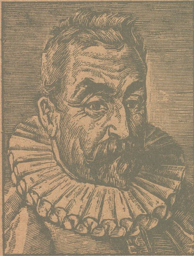
Jean Nicot brachte die Tabackspflanze nach Europa

Tabak, Tabak, Du edles Kraut! Der Mann sei lobenswert, Der dich gebaut! Der dich erbaut Und hat gepflanzt, Sei Lob und Ehr und Dank Sein Leben lang!