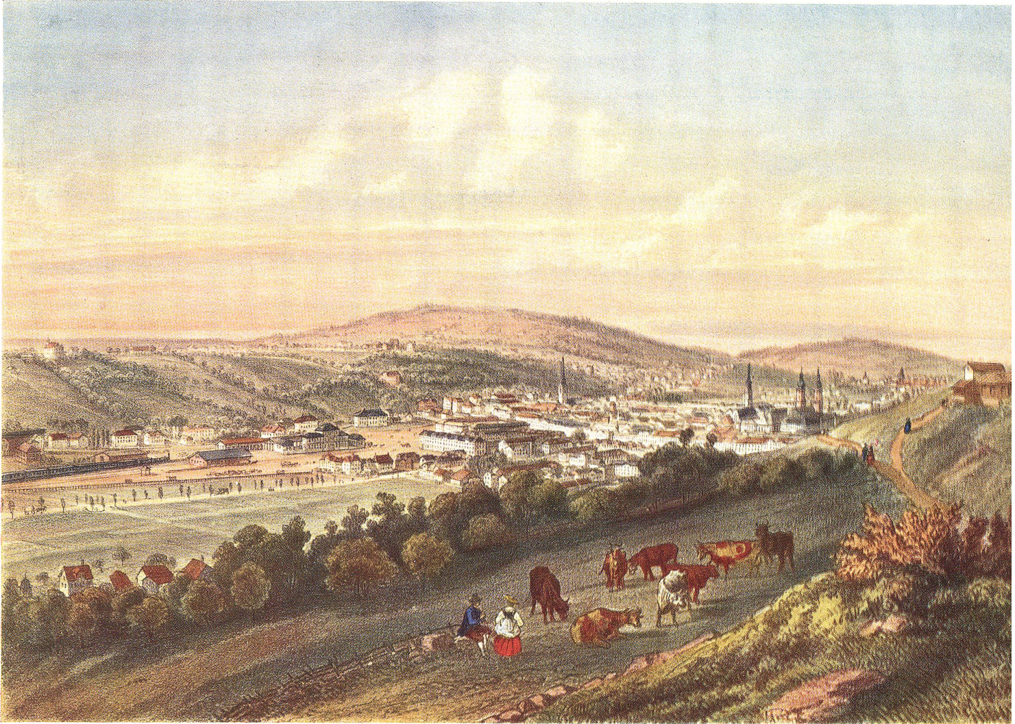
Die Stadt St. Gallen zur Zeit der Gründung der Helvetia-Gesellschaften