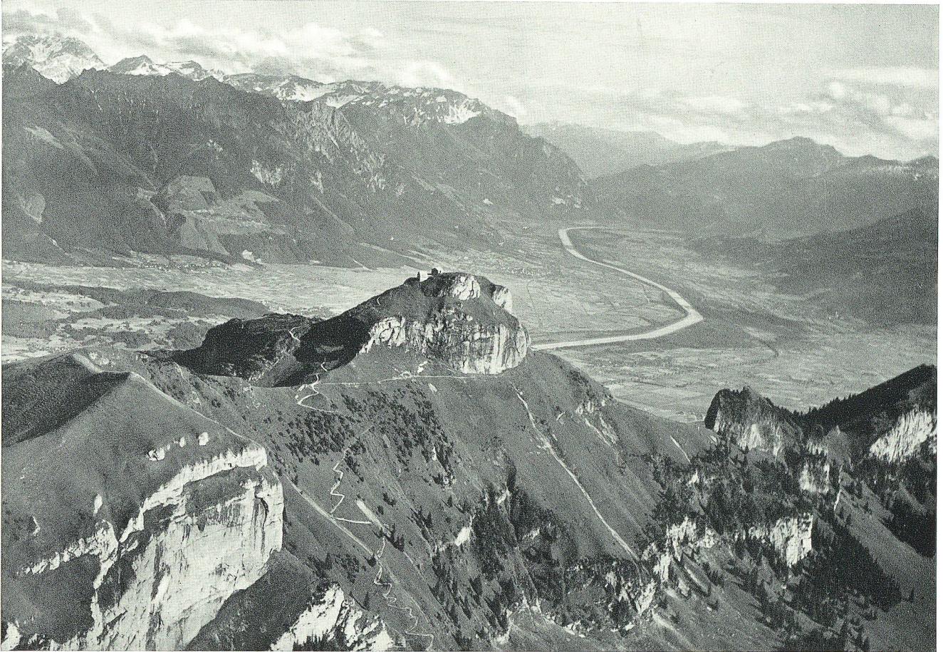
Hoher Kasten mit Blick ins Rheintal