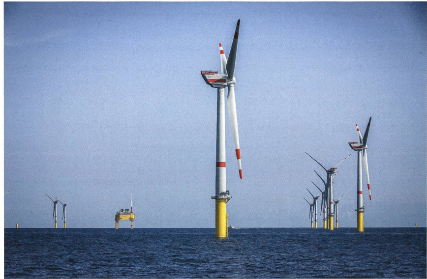
Der Offshore-Windpark Global Tech I in der Nordsee.

Axpo baut ihr Geschäft mit der Direktvermarktung von Strom aus erneuerbaren Energien in Deutschland weiter aus: Seit Jahresbeginn 2020 ist die deutsche Tochtergesellschaft von Axpo für die gesamte Vermarktung des Offshore-Windparks Global Tech I (GT I) in der Nordsee verantwortlich. Die entsprechende Ausschreibung hatte Axpo Deutschland Ende 2019 gewonnen.