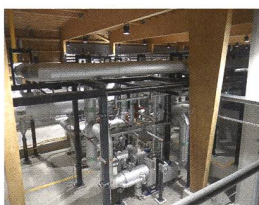
Inneres der Geothermie-Anlage.