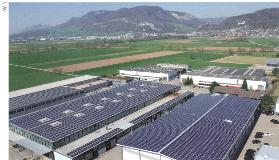
Fotovoltaikanlage in Kestenholz.

Die Anlage in Kestenholz bei Oensingen ist grösser als ein genormtes Fussballfeld und nutzt die Dächer zweier Industriehallen. Sie wurde im Januar 2015 in Betrieb genommen und am 28. April 2015 offiziell eingeweiht. Alpiq verkauft den Solarstrom dem lokalen Stromversorger Energie Kestenholz. Die Aare Energie AG erwirbt den ökologischen Mehrwert in Form von Zertifikaten. Die Anlage in Kestenholz zählt zu den grössten Fotovoltaikanlagen im Schweizer Mittelland. No