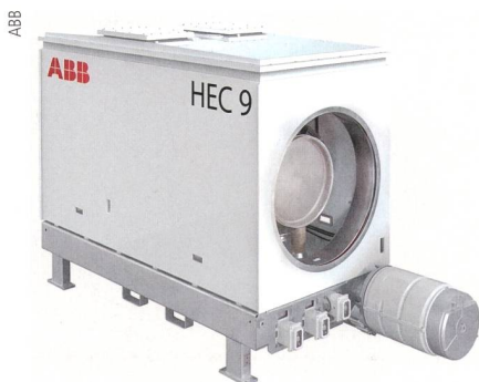
Kurzschlussströme bis 250 kA hält der Generatorleistungsschalter HEC 9-250 XL aus.

Generatorleistungsschalter von ABB sind seit über vier Jahrzehnten in Koziencice in Betrieb. Die ersten in Koziencice eingesetzten Schalter stammten noch von Brown Boveri & Cie. (BBC) aus den 1970er-Jahren. Der HEC 9-250 XL mit Nennströmen von 33,5 kA und Kurzschlussströmen von 250 kA wird durch ABB in Zürich gefertigt. Seit seiner Einführung im Jahr 2012 ist er der unübertroffen leistungsstärkste Generatorleistungsschalter weltweit. Er hat einen geringen Wartungsbedarf bei höchsten Sicherheits- und Zuverlässigkeitsstandards und erfüllt alle Anforderungen der heutigen Kraftwerke bis zu 1,8 GW. No