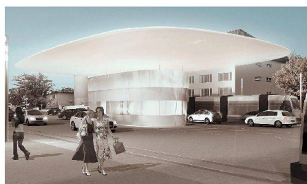
01-02 «Strahlend Weiss» (Zickenheiner Arch.)