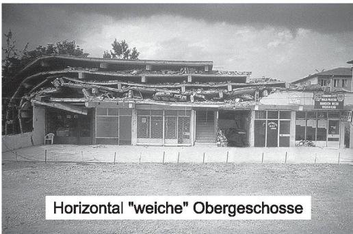
Horizontal "weiche" Obergeschosse