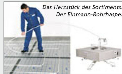
Das Herzstück des Sortiments: Der Einmann-Rohrspindel

Neben der bewährten Servicequalität unterstreicht Prolux damit seine Kompetenz auch im Flächenheizungsbereich.