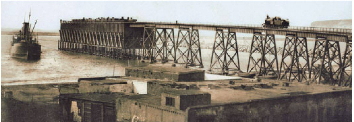
01 Verladestation für mineralische Rohprodukte im Hafen von Almeria (E), mit Transportschiff und dampfgetriebener Transportbahn, um 1905

Ein eindrückliches Industriemonument ragt weit in die Hafengebucht der südspanischen Stadt Almeria: der Embarcadero de Mineral «El Alquife». Die im Volksmund «Cable Inglés» genannte Verladestation für mineralische Rohprodukte auf Transportschiffe war von 1904 bis 1970 in Betrieb. Heute ist sie ungenutzt, eine Sanierung und allfällige Umnutzung ist aber geplant.