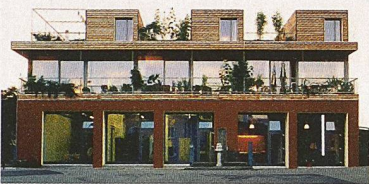
Gebaute Nachhaltigkeit: Umbau vom Bauern- zum Mehrfamilienhaus