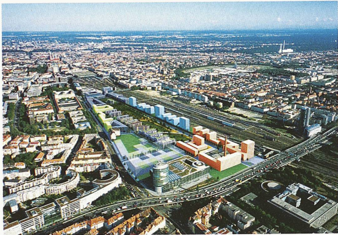
Luftbild-Montage Arnulfpark, München, Blick aus Nordwest. Beispiel für integrale Planung eines neuen Quartiers. Auf dem 18 ha grossen Areal nahe dem Münchner Hauptbahnhof entstehen 850 Wohnungen und 4300 Arbeitsplätze mit Versorgungs- und soziokulturellen Einrichtungen, guter Anbindung an den öffentlichen Verkehr sowie einem Park von 4 ha (Projekt: www.vivico.com / www.arnulfpark.de)