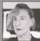
Riken Yamamoto Yokohama