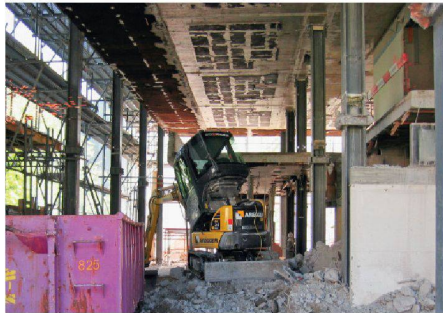
04 Rück- und Umbau des Zwischengeschosses, das neu bis zu den peripheren, hier noch zweigeschossigen Fassadenpfeilern reichen soll, erforderten eine detaillierte Planung der Etappierung