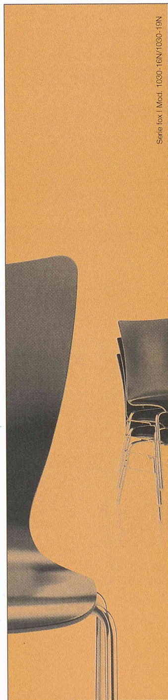
Serie fox | Mod. 1030-16N/1030-19N

Scherrer Metec AG Cupolux AG Allmendstrasse 5 8027 Zürich 044 208 90-40 | Fax -41 www.cupolux.ch