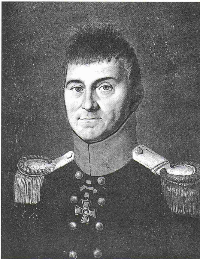
1 Johann Gottfried Tulla, 1770–1828