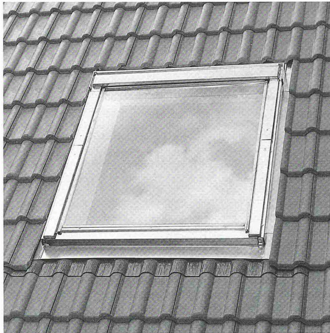
Verbesserte Integration ins Dach dank einem um 27 mm tieferen Einbau – die neue Dachfenster-Generation von Velux

Nemetschek Fides & Partner 8304 Wallisellen Tel. 01 839 76 76