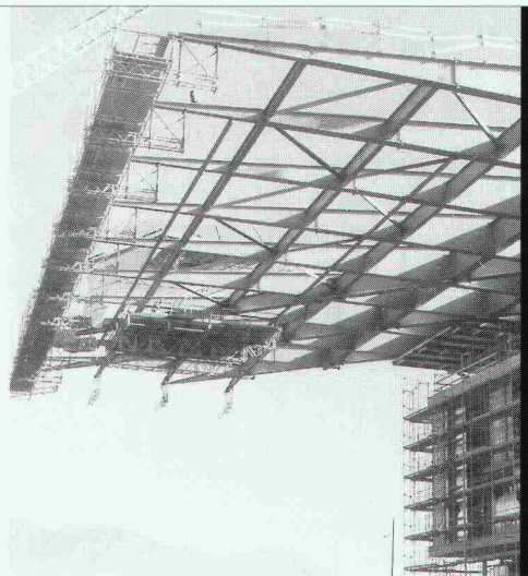
Projekt: Kultur- und Kongresszentrum Luzern Architekt: Jean Nouvel, Paris

Nur mit diesem Baustoff sind die grössten Spannweiten möglich, dies mit Berücksichtigung der Wirtschaftlichkeit und des vorteilhaften Leistungsgewichtes. Stahl bietet eine nahezu unerschöpfliche Fülle von Möglichkeiten, Ihre Ideen zu verwirklichen.