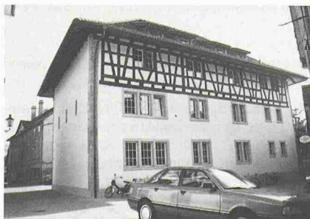
«Baroneschüür» in Winterthur

Eine Anerkennungsurkunde erhielt die Al- fredo Piatti AG, Dietlikon, für ihre neue