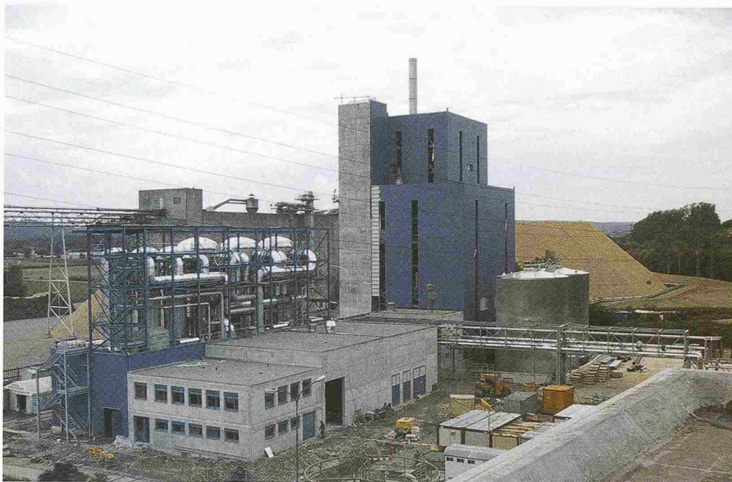
Die Cellulosefabrik Atisholz AG liefert gratis Abwärme

Als die Engros Schuhhaus AG im Sommer 1999 mit dem Projekt vorstellig wurde, im Industriegebiet «Nord» ein Verteilzentrum zu bauen, handelte der Gemeinderat sofort. Zusammen mit der kantonalen Energiefachstelle und dem Verein für Wirtschaftsförderung gab er eine Studie in Auftrag, die die Nutzung von erneuerbaren Energien prüfen sollte. Das Papier zeigte verschiedene Möglichkeiten auf, wie den Einsatz von Grundwasserwärme oder von Abwärme aus der nahen Kehrrechtverbrennungsanlage und der Cellulosefabrik Atisholz AG. Allen Vorschlägen gemeinsam war jedoch, dass die Jahreskosten über diejenigen einer konventionellen Öl- oder Gasheizung lagen. Die Engros