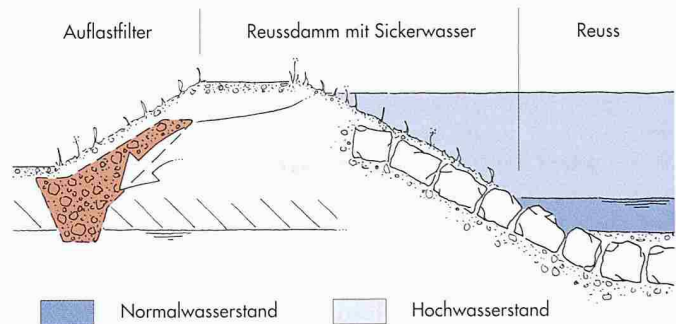
2 Querschnitt durch Damm mit Auflastfilter