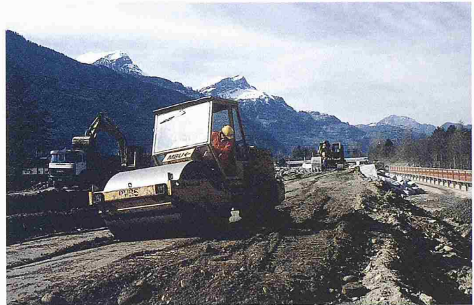
1 Klassischer Dammbau bei der Dammverschiebung unterhalb Brücke Seedorf

Drei Sanierungstypen wurden definiert. Der weitaus grösste Teil der Uferbereiche konnte einer Teilsanierung unterzogen werden: Wie bei einer Betonsanierung musste hier nur die äusserste Schicht