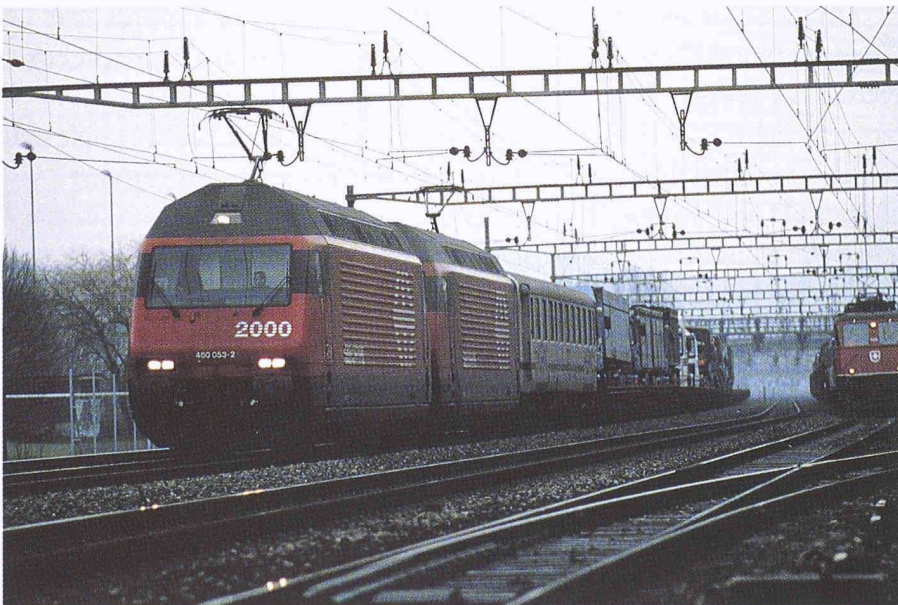
Um den Anforderungen ihrer wachsenden Infrastrukturen gerecht zu werden, führen die SBB unternehmensweit ein geografisches

Die Eisenbahninfrastruktur ist komplex. Sie umfasst eine Vielzahl von Fachdisziplinen: Fahrbahn, Ingenieurbau, Hochbau, elektrische Anlagen, Sicherungsanlagen und Telekommunikation. Planung und Erhaltung werden koordiniert vom Stab «Planung und Koordination», in dem auch die Dienstleistungen Informatik-Support und Vermessung integriert sind. Alle Bautätigkeiten an der Infrastruktur bzw. der jeweilige Zustand der festen Anlagen müssen für Planung und Erhaltung dokumentiert werden. Bisher hat eine Vielzahl von Stellen - die zentralen Planungsstellen, die Bauregionen vor Ort wie auch die Fachmeisterbezirke in der Fläche - Fachdienstdokumentationen erstellt und, nicht immer zuverlässig, nachgeführt. Innerhalb eines Fachdienstes erfolgte die Bearbeitung oft nach unterschiedlichen Normen. Folglich waren die Daten redundant und auch nicht immer auf gleicher Basis geführt. Durch die Mehrfachführung von Archiven entstand häufig ein Mehraufwand. Das in ungleichen Planbeständen doku-