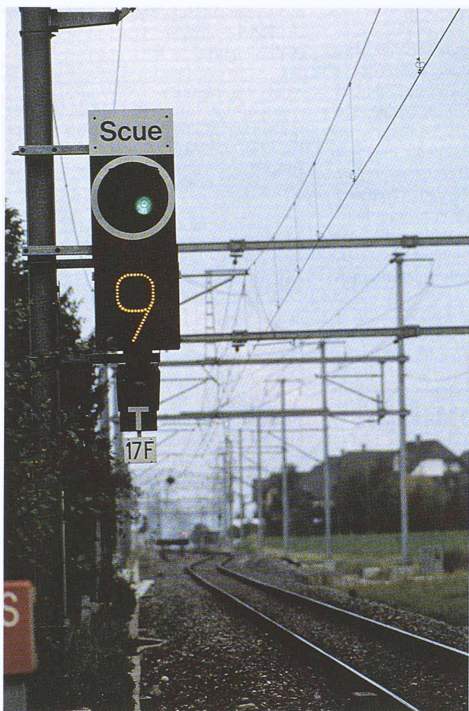
Die DfA verwaltet die Anlagen aller Fachdienste, gegliedert in Objektklassen (Fahrleitungsmasten, Brücken ...). Zu jedem Objekt der Objektklassen sind eine Reihe Daten und graphische Informationen verfügbar

des Ist-Zustandes kann mit der Hinterlegung von gescannten, bestehenden Plänen überbrückt werden.