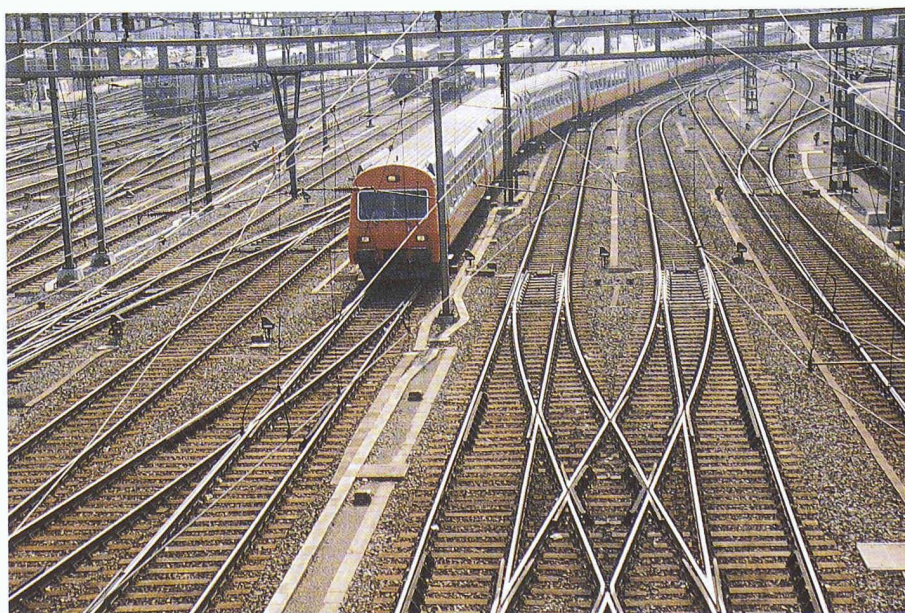
Neben 750 Bahnhöfen, 4000 Brücken und 260 Tunnels verfügen die SBB über 7000 Kilometer Gleise

Auf dieser Grundlage erfassen die Fachdienste ihre Anlagen, wobei sie wesentlich vom Vermessungsdienst unterstützt werden. Vorhandene Grundlagen werden dabei soweit als möglich berücksichtigt. Die Prioritäten für diese Arbeiten richten sich nach den Bedürfnissen der Kreise und berücksichtigen die Weiterbearbeitung von Projekten wie Bahn 2000 und Alptransit. Parallel zur Erfassung des Ist-Zustandes wird die DfA auch für die Bearbeitung von Projekten eingesetzt. Das Fehlen der Daten (insbesondere der Grafik)