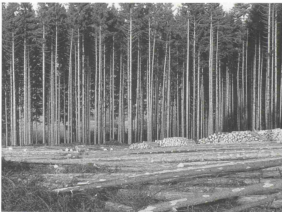
Bild 7. Durch die Anlage künstlicher Monokulturen im Kahlschlagbetrieb wird das natürliche Wald-Ökosystem zerstört. Wälder solcher Art sind für den Naturschutz wertlos und selber zahlreichen Gefährdungen aller Art ausgesetzt. Bild: Fichten-Monokultur auf einem natürlichen Laubmischwald-Standort im Mittelland

Was die forstgesetzliche Forderung der dauernden Erhaltung der Waldbestockungen und Erfüllung der Schutzfunktionen der Wälder betrifft, bedarf der natürliche oder naturnah aufgebaute Wald hierfür keiner menschlichen Pflege bzw. Nutzung. Auch ohne sie ist er in der Regel durchaus in der Lage, diesen Anforderungen nachhaltig zu genügen. Nur an relativ wenigen Orten, wo ein Waldteil in steilem Gelände unmittelbar zum Beispiel eine Siedlung zu schützen hat, können seine Überwachung und zielgerichtete Pflege unumgänglich sein – und auch in solchen Fällen wohl nur dann, wenn er früher als naturferner gleichförmiger Bestand ausgeformt oder gar als Monokultur angelegt worden war. Andererseits sind vom Menschen nicht genutzte, natürlich aufgebaute Waldteile, die dann auch nicht durch Transportanlagen erschlossen zu werden brauchen, für den Naturschutz, zur Erhaltung des natürlichen Artenreichtums und für den ökologischen Ausgleich in der Natur von gröss-