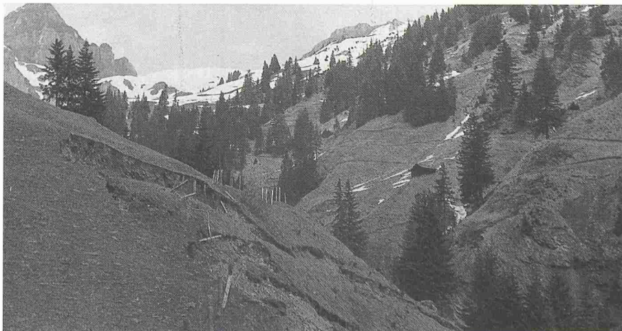
Bild 1. Hauptziel der eidgenössischen Forstpolizeigesetze war die Verbesserung der Schutz- und Produktionsfunktion der Wälder. Bild: Aufforstungsprojekt im früher schwach bewaldeten, rutschgefährdeten Einzugsgebiet des Gang-Baches im Urner Schächental, Stand 1943

Als 1902, also vor 87 Jahren, das heute noch geltende Bundesgesetz betreffend die eidgenössische Oberaufsicht über die Forstpolizei – mit seinem inhaltlich fast gleichen Vorläufer von 1876 mit Geltungsbereich nur über das Hochgebirgsgebiet der Schweiz – in Kraft trat, stellten Behörden und Bevölkerung ganz spezifische Erwartungen an die darin geforderte künftige Waldbewirtschaftung. Damals befanden sich grosse Teile unseres Waldareals in einem völlig verwahrlosten und verlichteten Zustand, was erwiesenermassen zunehmend häufig zu periodischen katastrophalen Überschwemmungen der gros-