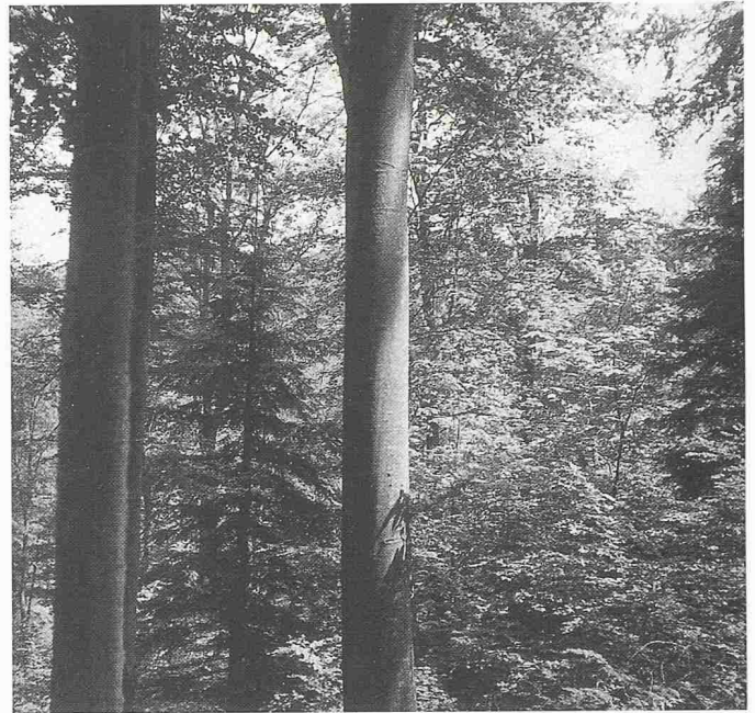
Bild 6. Auch Laubwälder lassen sich durch naturnahe Ausformung so gestalten, dass in ihnen das natürliche Ökosystem bei gleichzeitig intensiver Nutzholzerzeugung dauernd erhalten bleibt. Bild: Plenterartiger Laubmischwald im Schwäbischen Wald