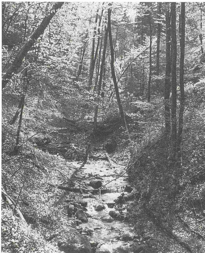
Bild 3. Im Vergleich zur offenen Zivilisationslandschaft bergen die Wälder noch viel mehr natürliche Besonderheiten wie auch Reste kulturgeschichtlicher Art, die erhalten und gepflegt werden sollen. Bild: Im natürlich gebliebenen Brüeltobel bei Winterthur