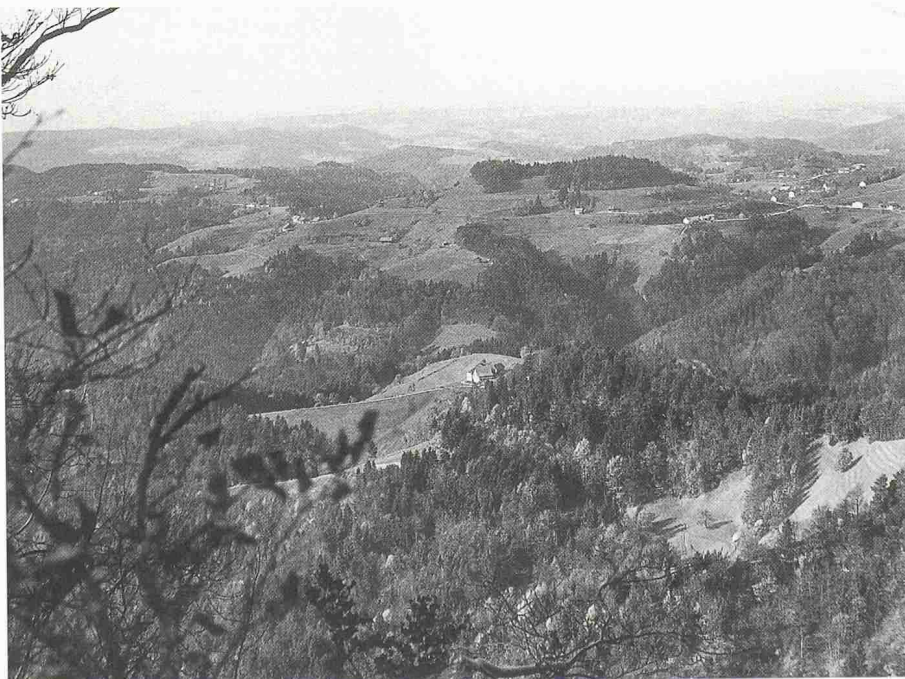
Bild 2. Dieses Ziel ist heute weitgehend erreicht worden. Bild: Im Einzugsgebiet der Töss im Zürcher Oberland, eines früher gefürchteten Wildwassers, ist der Waldanteil durch Aufforstungen stark erhöht worden. Der Fluss hat seinen einstigen Schrecken verloren

Immer nachdrücklicher erhebt sich daher aus Kreisen des Natur-, Landschaft- und Umweltschutzes die auch durch zahlreiche neuere einschlägige Erlasse gestützte Forderung, dass unser Waldareal so bewirtschaftet bzw. gestaltet werden muss, dass es neben seinen traditionellen Aufgaben auch alle diese weiteren, heute aktuell und dringlich gewordenen Bedürfnisse optimal erfüllt