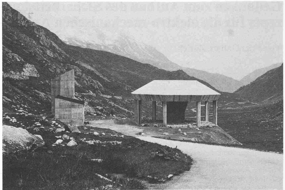
Bild 3. Aussenbauwerk Guspisbach, Ansicht von Süden

Da die vorhandenen Platzverhältnisse der architektonischen Gestaltung mehr Spielraum übrig liessen als z.B. beim Schachtkopf Bätzberg, treten die archi-