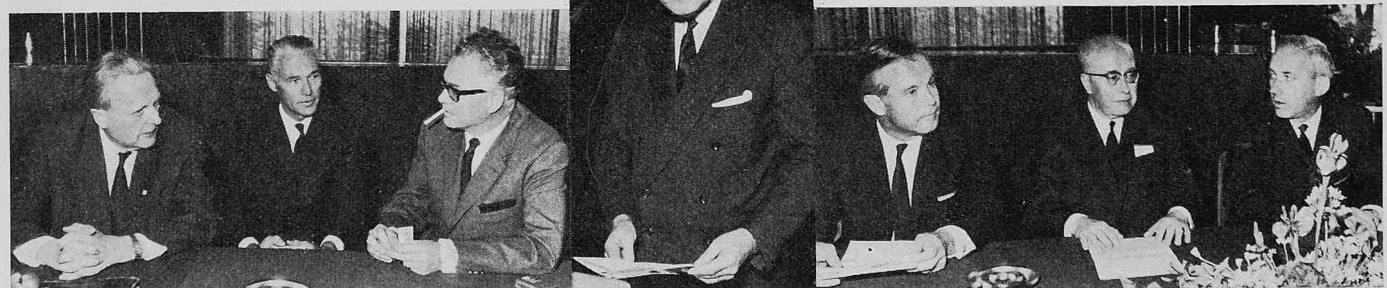
Das Central-Comité des SIA an der Generalversammlung vom 17. Juni 1967 in Bern