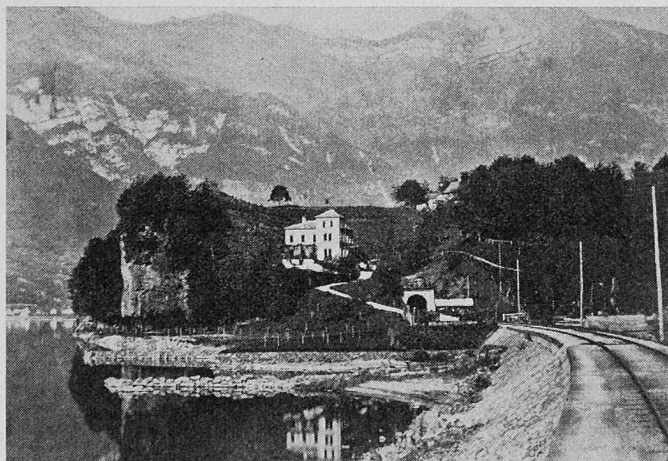
Bild 3. Haus Bommerstein, erbaut 1860–1861, aus Südwesten, mit der 1859 dem Betrieb übergebenen Bahnlinie, aber ohne die 1889 eröffnete Kantonsstrasse. Photo um 1865

verdankt sei. Verschiedene Blätter aus zum Teil längst eingegangenen Zeitungen mit Nachrufen und anderen zeitgenössischen Äusserungen über Pestalozzi sowie seine Liegenschaft bei Mols betreffende Kaufverträge usw., die in dieser Studie benützt wurden, fanden sich im Nachlass seiner Nichte, Frau Helene Escher-Pestalozzi (1870–1964).