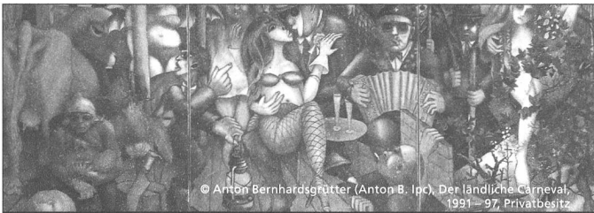
© Anton Bernhardsgrütter (Anton B. Ipc), Der ländliche Carneval, 1991-97, Privatbesitz

museum im lagerhaus. stiftung für schweizerische naive kunst und art brut .