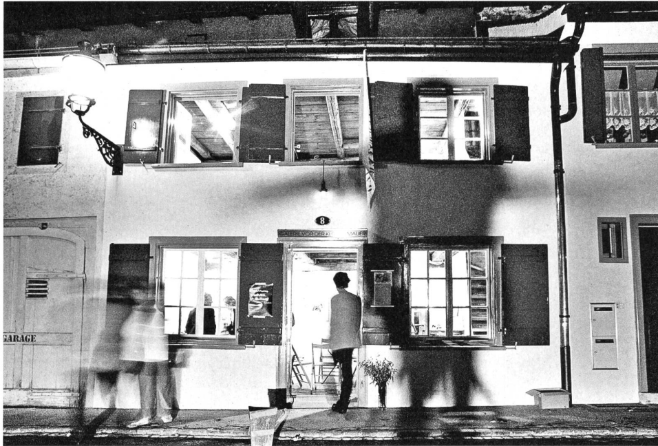
Kunst-Lichtblicke seit 45 Jahren: die Galerie vor der Klostermauer.