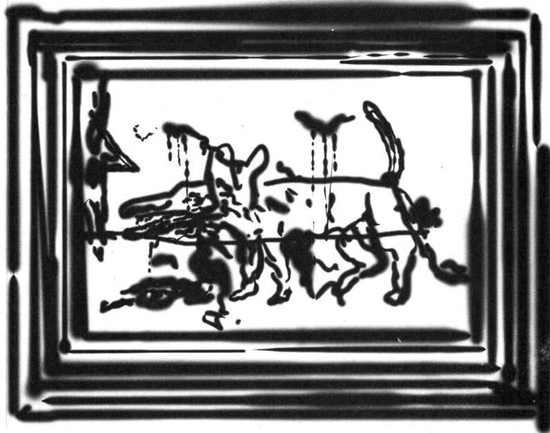
"Das Fenster zum Hinternhof", 1982, Mischtechnik PRIVATBESITZ value : 12'000'000 Dollars