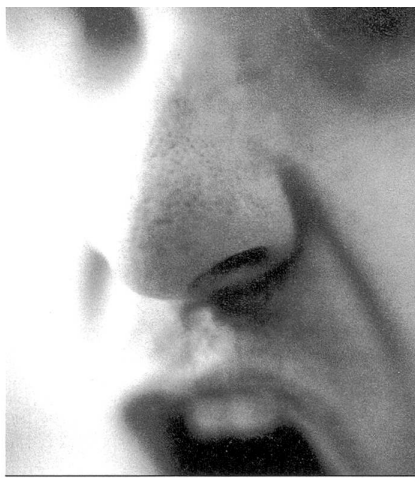
«Jeden Morgen ist man 18 Jahre alt, abends 81.» (Jean Paul)