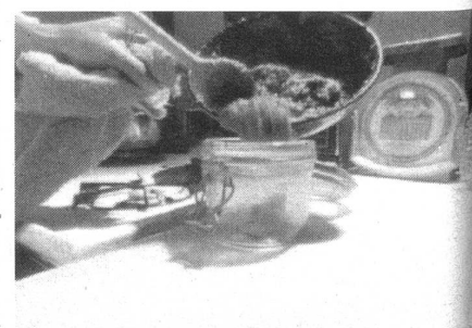
[Videostill aus: «do it (TV-Version)», ORF/museum in progress, 1995/96]