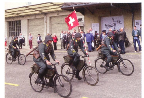
Detachment Historische Radfahrer Kp