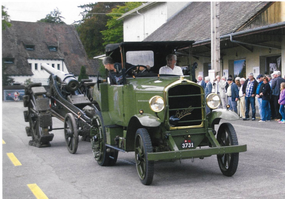
Berna Artillerie Traktor mit Radgürtelkanone

Nebst dem Festakt und den Vorführungen fanden die Besucher Zeit, um die Ausstellungen zu besuchen oder sich in der Museumsbeiz zu stärken. Für das Schlussbouquet sorgte das PC-7 Team der Schweizer Luftwaffe, welches über das Zeughaus flog und den dort Anwesenden seine «Grussbotschaft» überbrachte.