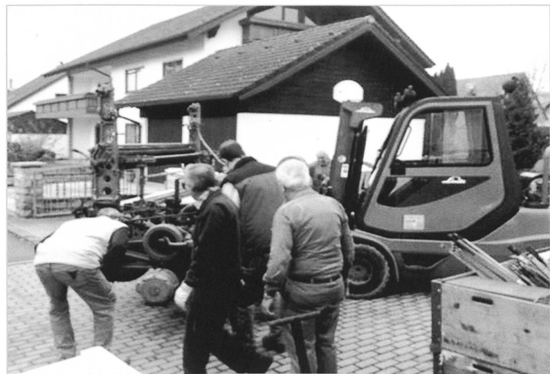
Vorsicht ist geboten beim Verladen der Maschine