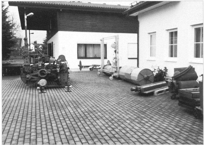
Die Maschine mit Zubehör steht zum Abtransport bereit