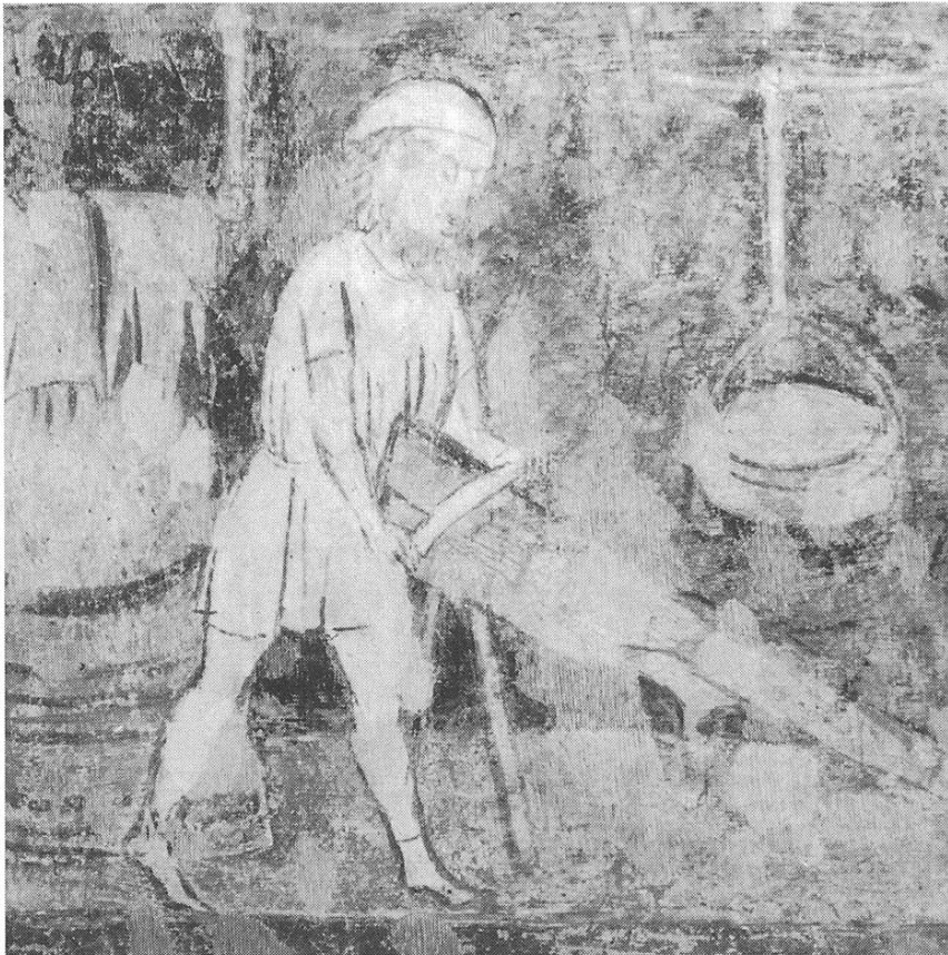
Teilansicht des Feiertagschristus. Darstellung in Pitasch. Der Kürschner beim Ausputzen und Säubern der Felle.

Der heutige Mensch, wie wir es untersucht haben, kennt den Sinn solcher Bilder kaum mehr. Und doch freut sich heute der Bewohner eines Kirchspiels, wenn ein Bild von solcher Bedeutung neu zum Vorschein kommt.