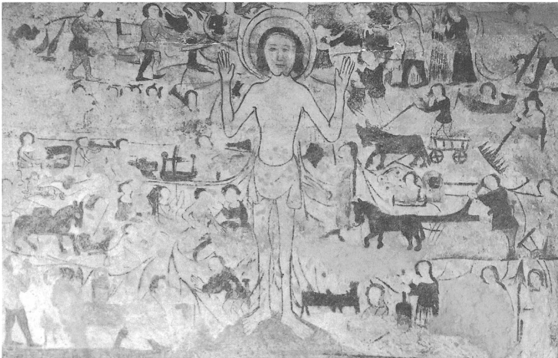
Breitflächiges und auch kulturhistorisch besonders interessantes Bild des Feiertagschristus am Glockenturm der Kirche von Schlans.

Auf der Durchgangsrouten in Schlans waren wohl Säumer und Saumpferde zu sehen. Der Bauer aber verwendete weder Pferde noch Wagen angesichts der schlechten Wege auf Wiesen und Feldern. Der Bauer, auf dem Wagen stehend über hol-