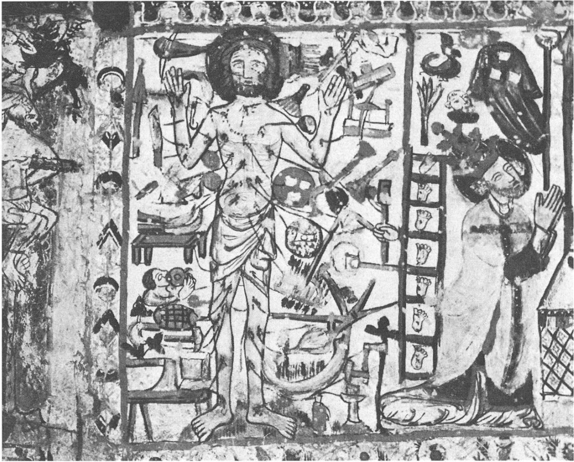
Gut erhalten blieb dagegen das Bild des Feiertagschristus im Innern der Kapelle St. Georg in Rhäzüns

Der Feiertagschristus auf der Aussenwand der Kirche von Waltensburg zeichnet sich durch die klare, eindruckliche Gestaltung aus. Die schwebende Körperhaltung sowie die Haltung der Hände wirft Probleme auf. Unter den Füßen der Hauptgestalt sehen wir eine markante Ackerhaue, ein Sensenblatt, ein Speichenrad, daneben Dinge, die noch nicht befriedigend ermittelt sind. Zur Schau gestellt ist die Schaufel. Ihre Verkehrtheit sticht in die Augen. Unter der verkrampften rechten Hand Christi befindet sich eine antike Form einer Zimmermannsaxt; seitlich, dem Körper entlang bis hinauf unter den Arm reicht die Lanze; kniend, recht auffällig die Bildstifterin mit einer weiteren Person. Die Gestalten oben rechts sind als spielende Gesellen identifiziert worden. Merkwürdig dünkt uns der Tänzer vor den aufgeputzten Jünglingen. Ob das