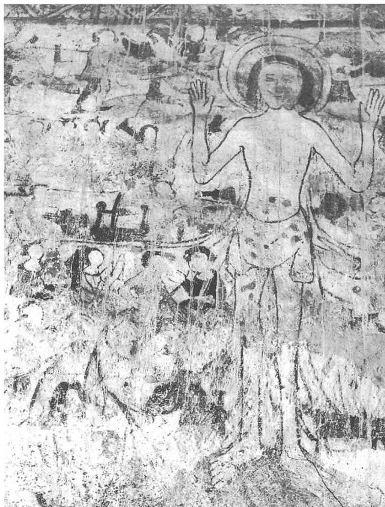
Feiertagschristus Schlans. Teilansicht.

Gut sichtbar auf dem Bild ist die Waldsäge mit einem der klobigen Schäfte. Dieses heimtückische Zahnschneidewerkzeug ist auf halber Höhe gegen den Körper Christi gerichtet. Links vom Feiertagschristus, von unten nach oben, befindet sich eine Mühle. Das Mühlrad beweist es, ebenfalls auch der Esel, der vor der Mühle von seinen Kornsäcken befreit oder mit Mehlsäcken beladen wird. Solche Darstellungen, Hauptsituationen, zentrale