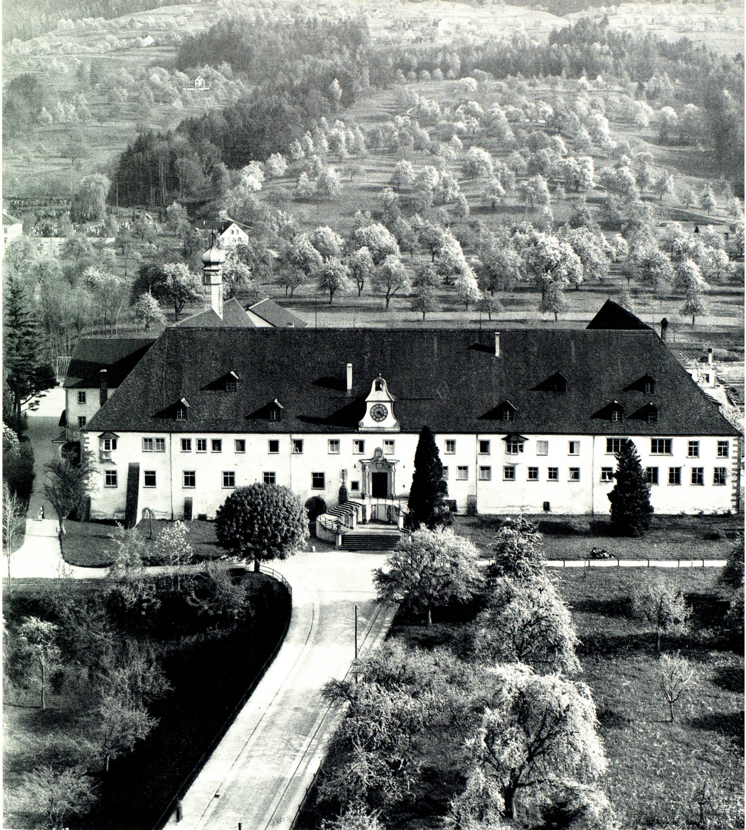
Seminar Marienberg, Rorschach

In voller Blüte prangten die Birnbäume am Rorschacherberg, als Bernhard Moosbrugger vom Turm der Jugendkirche aus diese ebenso schöne wie instruktive Aufnahme des Seminars machte. Auch die drei folgenden Bilder verdanken wir dem gleichen jungen Künstler.