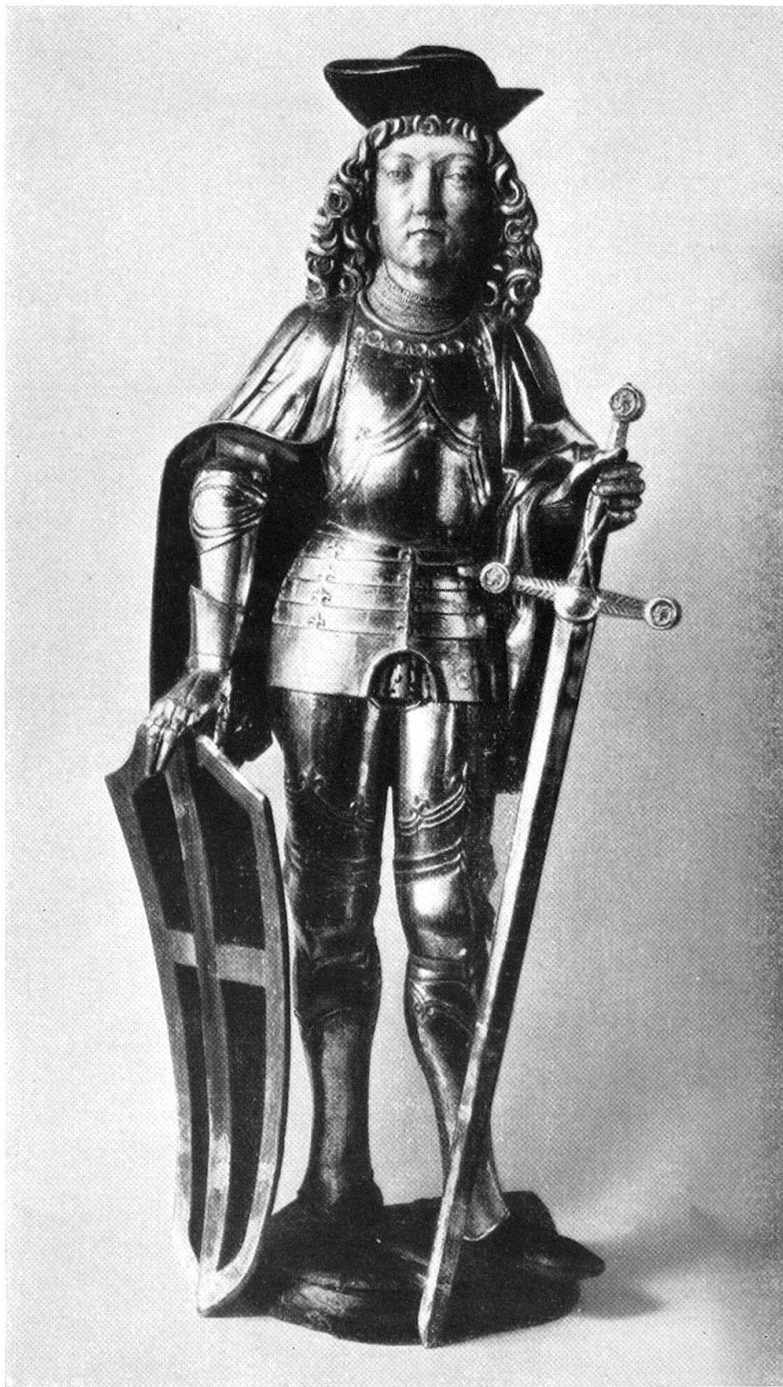
Saint Victor-Maur. De l'église San Vittore à Roveredo (Misox). Vers 1500.