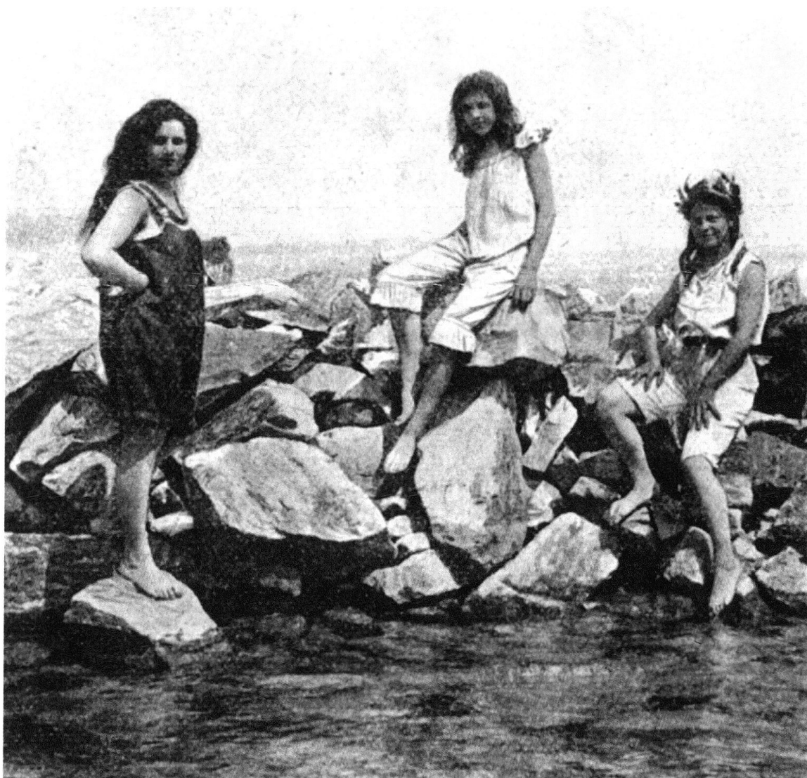
2 Lors du «Championnat suisse et du Léman» du 21 juillet 1907 à Genève, trois nageuses étaient engagées (photo parue dans La Suisse Sportive , 3 août 1907).