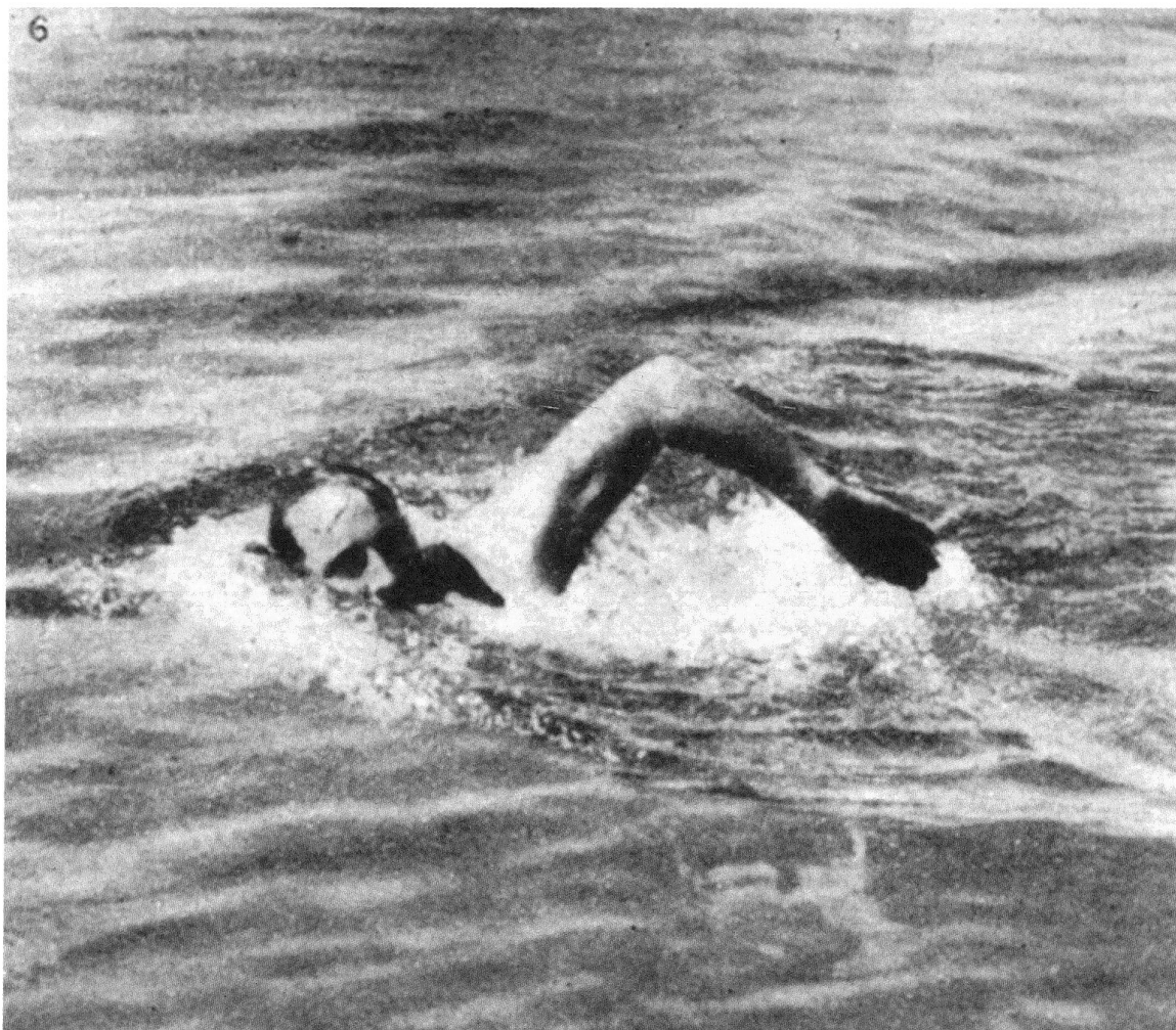
1 Henri Demiéville, meilleur nageur romand des années 1910/1920, a été la source du conflit qui a amené la création de la Fédération en 1918.