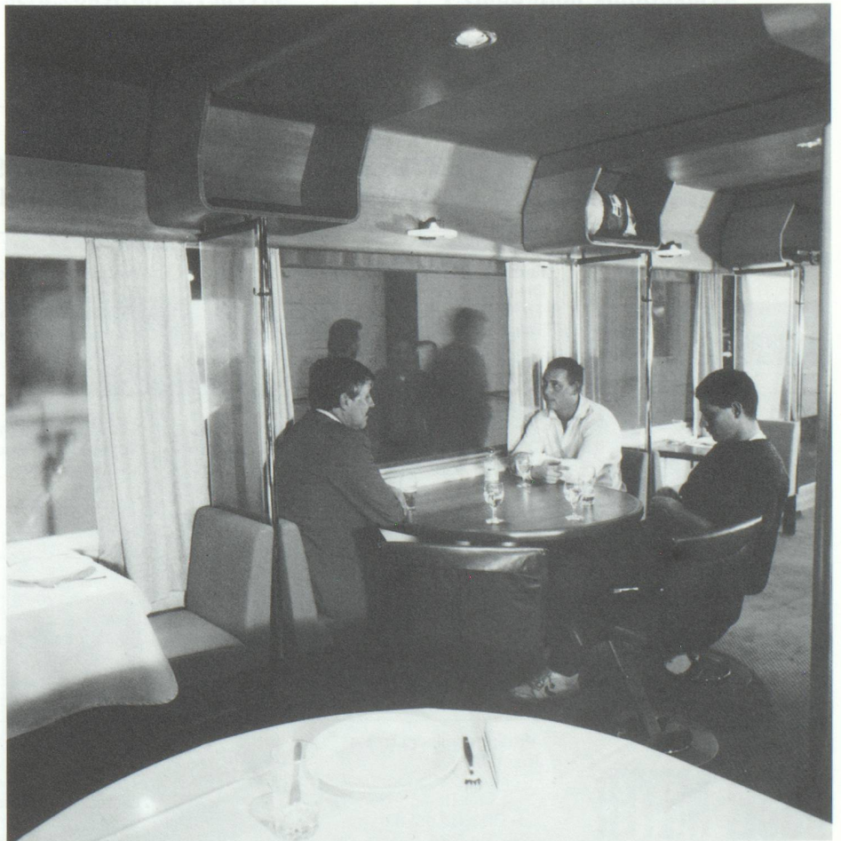
Vue intérieure du wagon-restaurant.