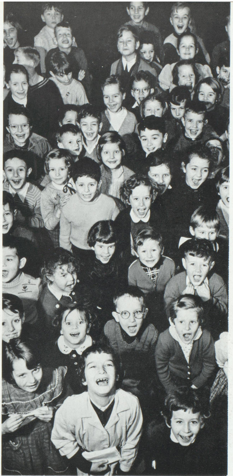
À l'École européenne de Luxembourg.