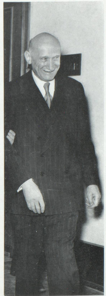
Konrad Adenauer, Jean Monnet, Robert Schuman : une génération d'Européens.

années pendant lesquelles des peuples entiers ont vécu dans la hantise d'un recommencement. Quand ils ont entendu en 1950 qu'on les appelait à s'unir, ils ont été bouleversés. Les uns ont dit : c'est trop tôt, notre rancune ne peut pas s'éteindre si vite. D'autres, les plus nombreux, ont choisi la réconciliation. Six pays ont convenu d'un pacte d'oubli et se sont liés dans une organisation commune.