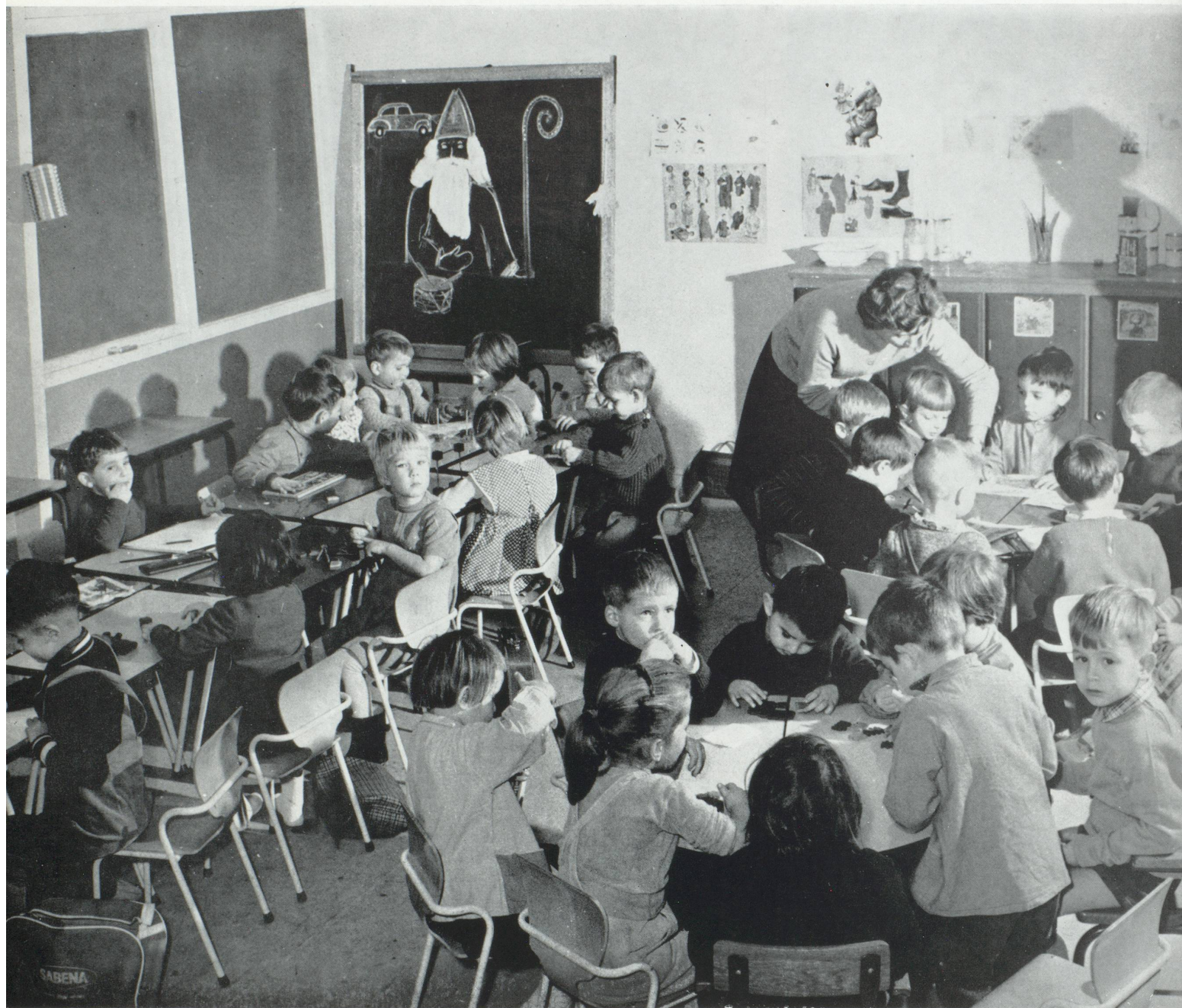
L'École européenne de Bruxelles.

dérable en matière d'opinion publique, des trois quarts, et les autres restant au-dessous de 10 p. 100. Une majorité de plus du tiers voit cette réalisation dans un avenir proche : cette évaluation de l'avenir est la même quel que soit l'âge. Faut-il en conclure que les jeunes ont l'impatience de la jeunesse, et leurs aînés l'impatience de ceux qui ont trop attendu ? Il semblerait plutôt qu'il faille chercher des rai-