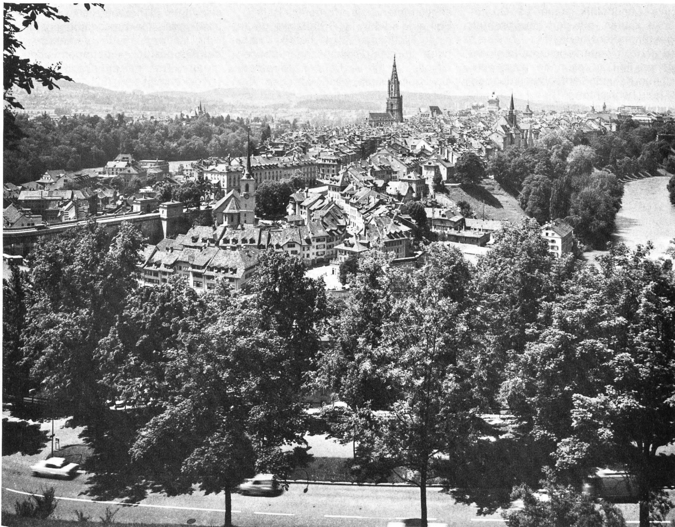
Blick vom Rosengarten auf die Altstadt Bern. Durchgrünung längs der Aaretalhänge

Privatrechts durchsetzen. Gegenüber Schutzverfügungen haben die Dienstbarkeiten den Vorzug, dass sie ins Grundbuch eingetragen werden müssen und daher für jeden Interessenten offenkundig sind. Personalservitute im Interesse der Grünplanung sollten nach Möglichkeit vertraglichen Pfandrechten vorgehen, da sie sonst gefährdet sein können [39]. Mit der Dienstbarkeit kann grundsätzlich nur eine Duldungs- oder Unterlassungspflicht gesichert werden. Verpflichtungen zur Vornahme von Handlungen können nach Artikel 730, Absatz 2, ZGB nur nebensächlich festgelegt werden. Stehen etwa Unterhaltspflichten im Vergleich zu Unterlassungs- oder Duldungsgeboten im Vordergrund, so müssten sie durch Grundlast (Artikel 782ff. ZGB) gesichert werden. Diese kann aber nach Ablauf von 30 Jahren zwingend abgelöst werden. Sie ist ausserdem wegen des Rechts auf Verwertung des belasteten Grundstückes für die Grünplanung nicht geeignet [40].