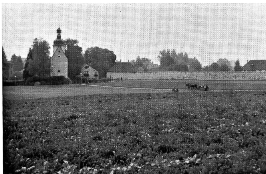
Abb. 2. Ein beschauliches Stück Natur — mitten im Siedlungsgebiet. Die Loretowiese darf inskünftig nur noch landwirtschaftlich genutzt oder mit Kinderspielplätzen und Parkanlagen versehen werden