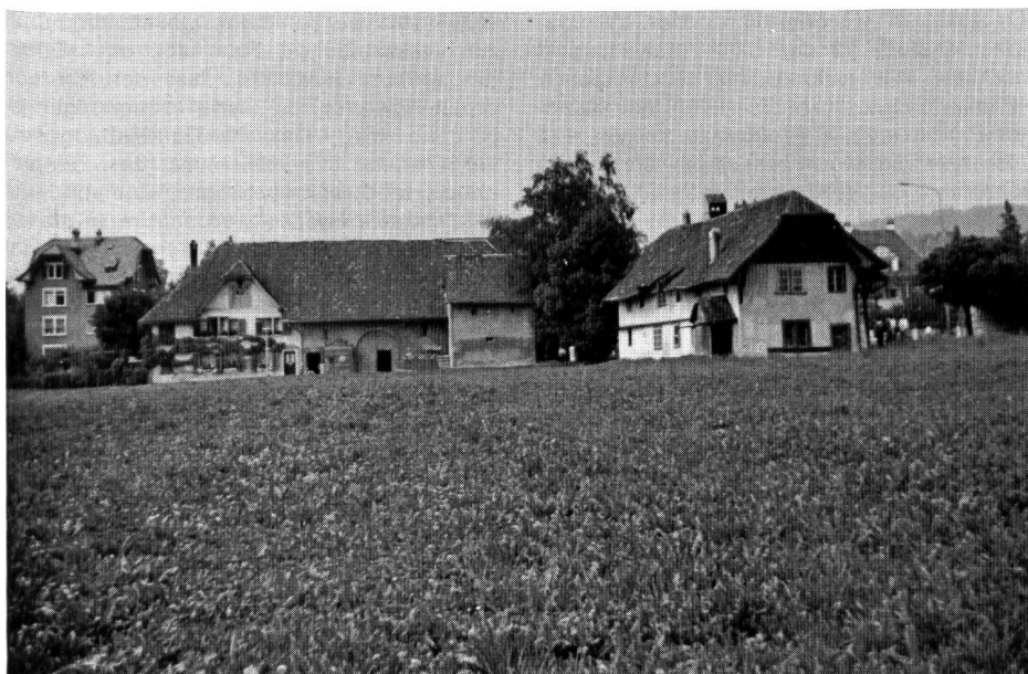
Abb. 1. Die baulich bereits genutzten Parzellen (1 und 2 im nebenstehenden Gesamtplan) in der Grösse von insgesamt 3000 m 2 sind heute im Besitz der Stadt Solothurn. Die Grundstücke unterliegen gewissen Nutzungsbeschränkungen im Interesse der Gesamtanlage und des Klosters «Namen Jesu»

Der glückliche Abschluss des Vertrags verdeutlicht wieder einmal, dass die Erhaltung schützenswerter Objekte auch dann möglich ist, wenn verschiedenartige Forderungen anfänglich unvereinbar erscheinen. Die Grosszügigkeit beider Seiten vermittelt der Bevölkerung der Stadt Solothurn ein weiteres Stück unbeeinträchtigter Ruhe und Tradition und berücksichtigt die berechtigten Anliegen einer Gemeinschaft, die damit am praktischen Beispiel beweist, dass ihr der Dienst am Menschen wichtig ist.